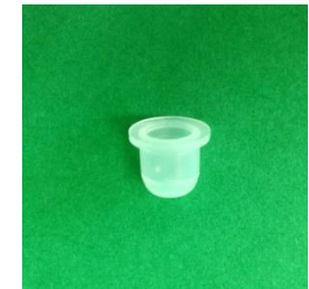
M310 ガラスバイアル用キャップ ×100