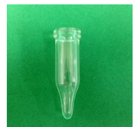
H255 ガラスバイアル ×100