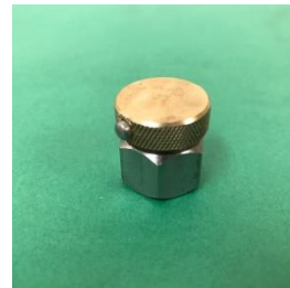
H500 シーリングプラグ ×16