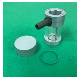
H815 バキュームベッセル