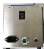
温度コントローラー裏面