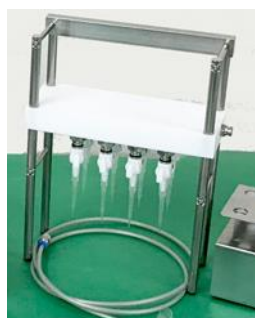
AHST-8BS 8ポジションブロースタンド チップ×8本 窒素ガス用チューブ (付属)