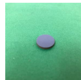
H400 PTFE セプタム ×100