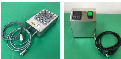
AHST-16HB 16バイアル用ヒートブロック AHST-16TC 16バイアル用温度コントローラー