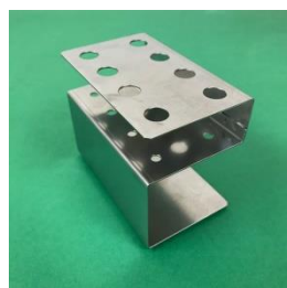
AHST-8L 8ポジションバイアルラック ×2