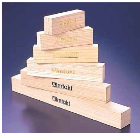
オンリーワンの製品で信頼の高いHPLCカラム